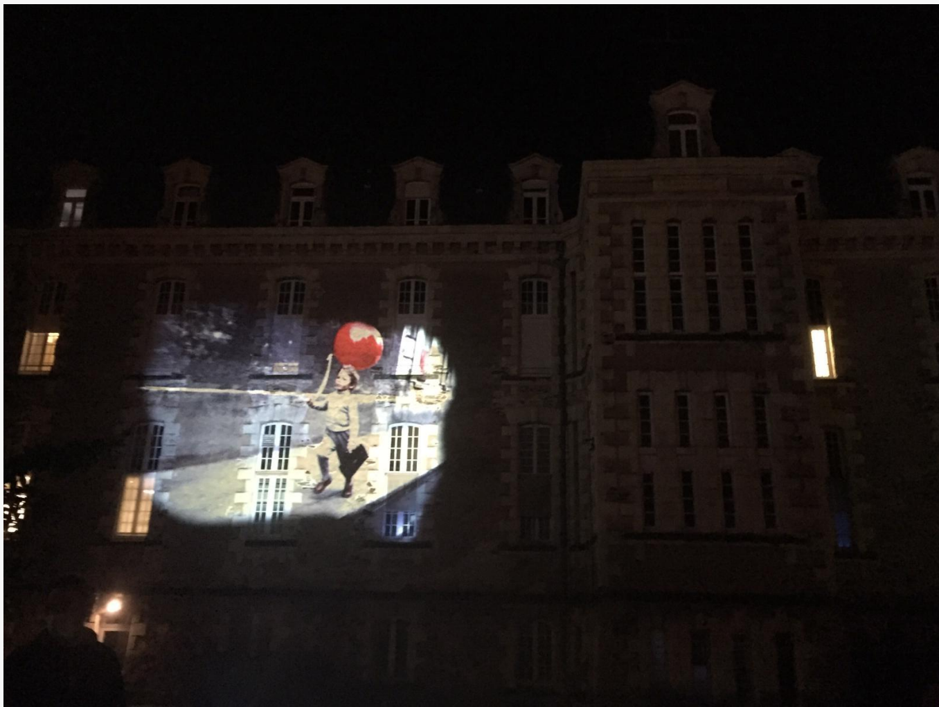
Extrait de l' Allée des Baisers , le Carré, Scène nationale et centre d'art contemporain d'intérêt national